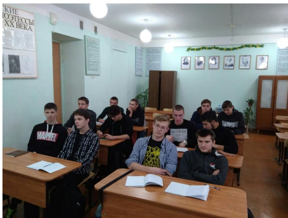
10 группа «Электромонтеры»